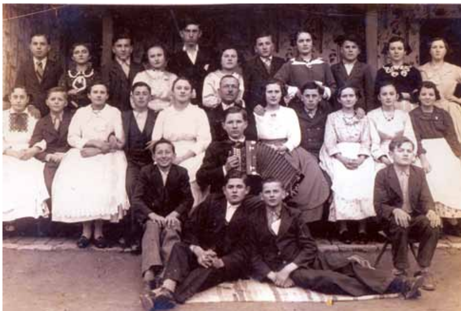
„Брацковање” у Старом Врбасу 1939. године

Русинско Просветно друштво у Ст. Врбасу 1934. године почело је да припрема „Преносну уметничку изложбу” с циљем да с њом гостује по русинским селима. Били су позвани уметници, сликари и вајари, да пријаве своје радове ако желе да учествују у тој акцији. 21 Није нам познато да ли је та акција била реализована.