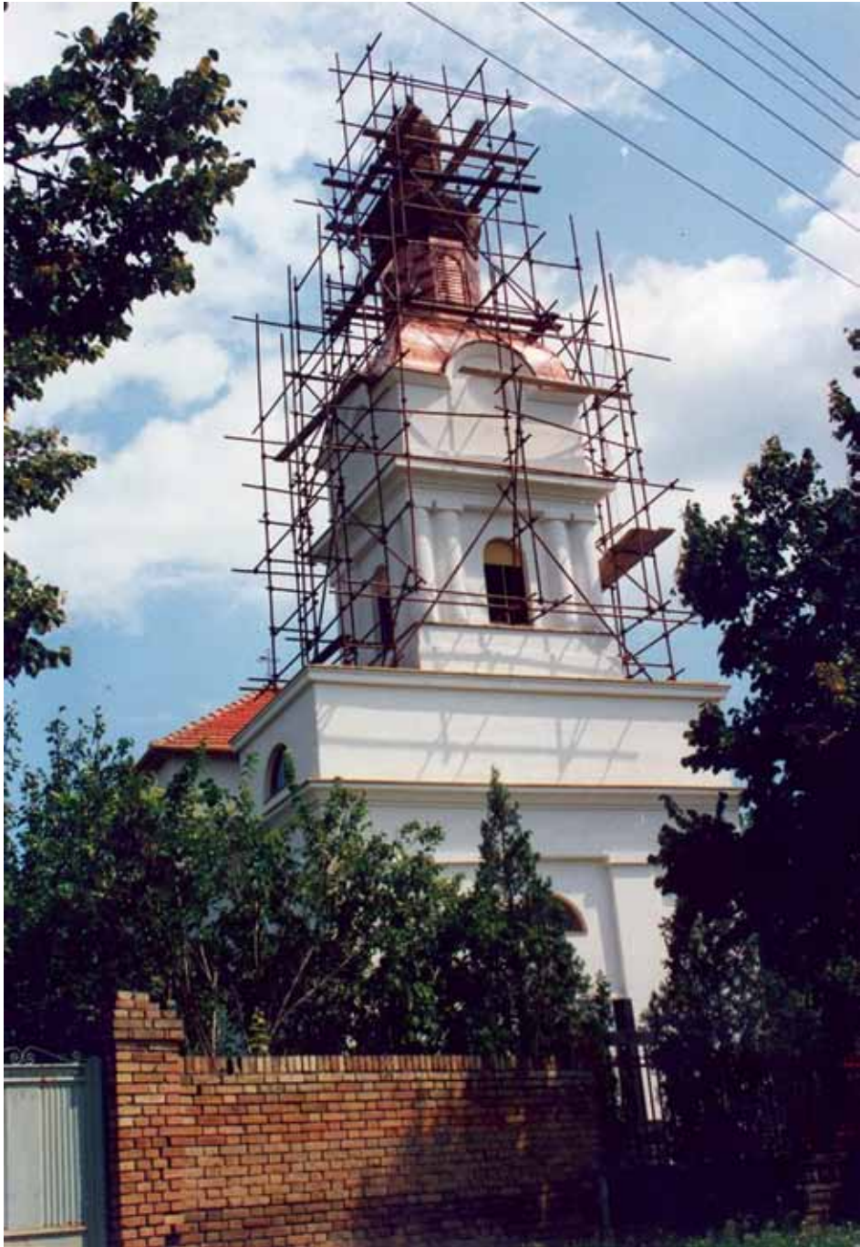
Реновирање цркве у Старом Врбасу