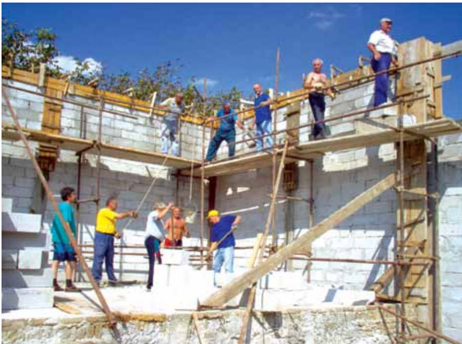
Аматери „на високом нивоу”, 2005.

Припрема за изградњу сале започела је 27. маја 2005. године и то рашчишћавањем дворишта и припремом терена, а сама градња је започела 4. јуна 2005. копањем темеља за будућу бину. Према пројекту сала је дуга 22 метра, а широка 9 метара. Бина је величине 6 × 9 м, а испод бине се налази мала сала за пробе фолклора или неке камерне изведбе. Предвиђени капацитет сале је 180 места, тако да ће изградњом овог комплекса аматери „Карпата“ коначно добити одговарајући простор у коме ће моћи несметано одржавати пробе и публици показати оно што припреме.