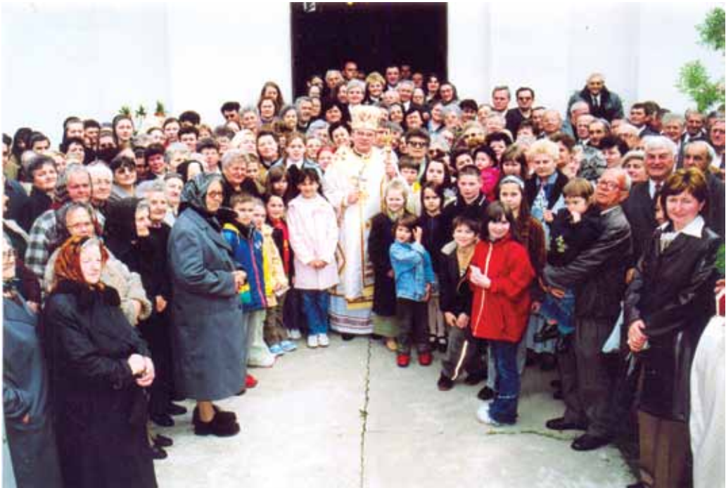
Парохияне Старого Вербасу зоз своїм владиком