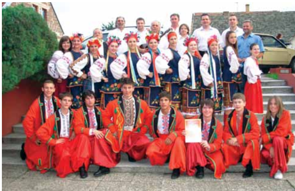
Панонски козаци – фолклорни ансамбл

лежио први међународни наступ испред „Карпата” у Свидњику (Словачка). Хорска секција учествовала је приликом снимања разних телевизијских пројеката Русинске редакције Радио телевизије Нови Сад. Касније су уследиле награде и признања, а у другој декади постојања Друштва хор је постао својеврсни расадник мањих певачких група и соло певача.