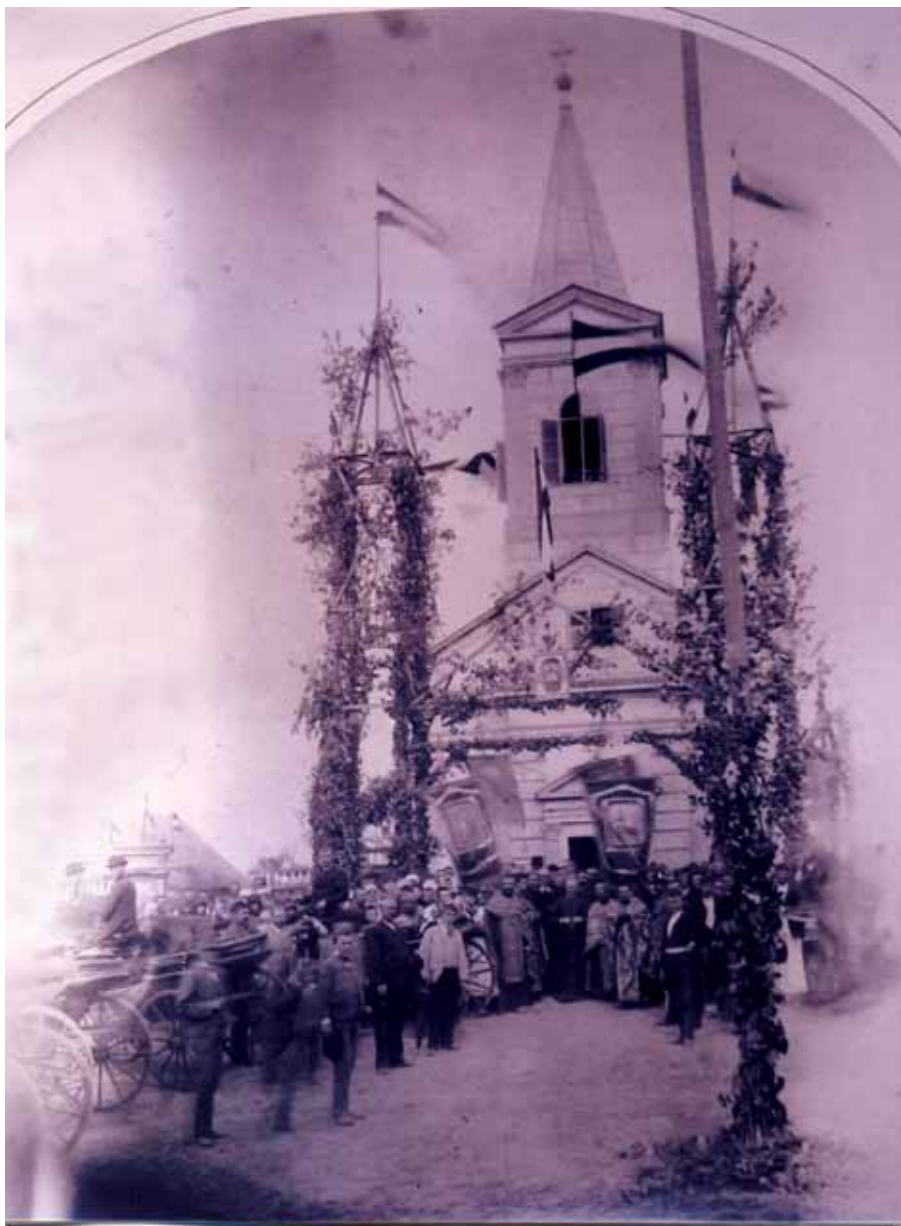
Пароҳияне пред стару цркѡу – 1892.р.