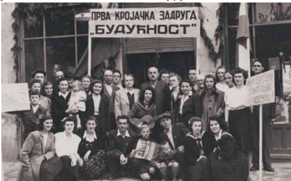
Фамелия Влади Хромиша у ПКЗ „Будучноц“ 1946. року

Од штирох спомнутих местах найрозвитше ремеселніцтво у Бечею, вец у Србобране, Кули и найслабше розвите у Вербаше. У Бечею на 64 роботнікох приходзи єдна ремеселніцка роботня и кажди 21. житель роботнік у ремеселніцтве, а кажди 138. житель школяр у ремеселніцтве.