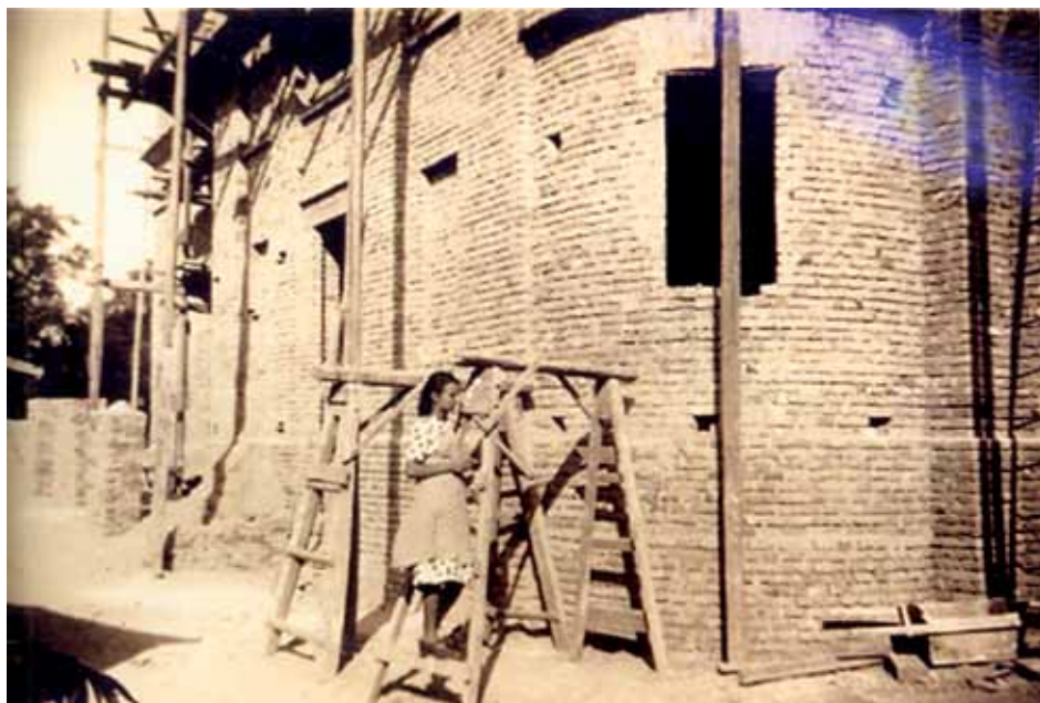
Зидање цркве 1939/1944. године

да ће се тако у Ст. Врбасу све смирити. Због тога је упозоравао да се ово питање мора брзо решити, да се његовим одлагањем не би дало повода да људи своје незадовољство искажу преласком на православну веру, што би могла да убрза и појача православна агитација. Да се то не би догодило, „јер овде међу руским народом треба да само један нешто počне – други га одмах сlijеде особито ако је dotičни мало uplivнија osoba међу народом”, молио је да Духовни стол што пре донесе повољно решење на молбе верника ове парохије. Ту Трбојевић спомиње да су неки гркокатолици већ контактирали са месним православним парохом и да им је он обећао да ће сваки гркокатолик који пређе на православну веру добити опрост од плаћања најмање четири године, што може да буде веома примамљиво за многе сиромашне Русине да промене веру у нади да ће бар мало побољшати свој материјални положај (Рамач 1988: 698–700).