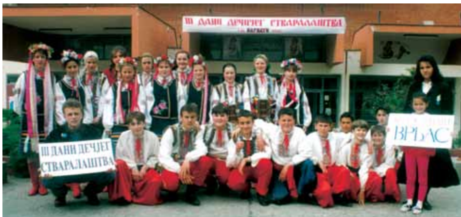
Дани дечјег стваралаштва, 1994.

Од 2008. године кренула је експанзија омладинске фолклорне секције, велики је прилив младих талентованих играча и то се одразило на бољи квалитет фолклора, који из године у годину све више напредује. Ансамбл је мултинационалан, као и град Врбас, а на наступима, од укупно 30-ак чланова редовно учествују од 16 до 24 девојака и момака.