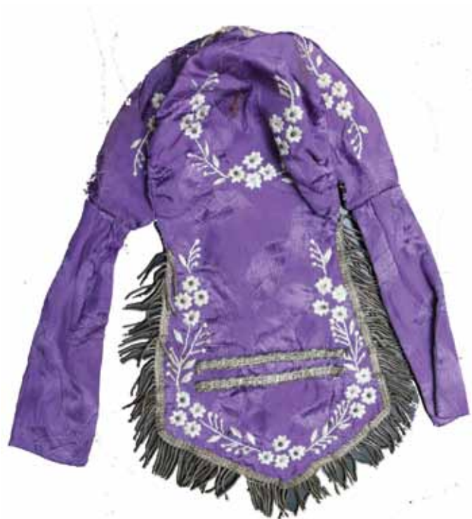
Фитюла. Музейска збирка Културног центра Вербас.

Now, in 2015, when Vrbas marks the eighth consecutive Central celebration of the Day of the Ruthenian people, „Karpati” association celebrates its 25th birthday. I feel a great responsibility and honour to be with my associates, amateurs and compatriots, to actively participate in the celebration of these important dates for the Ruthenians in Vrbas, as well as for those in the whole of Serbia.