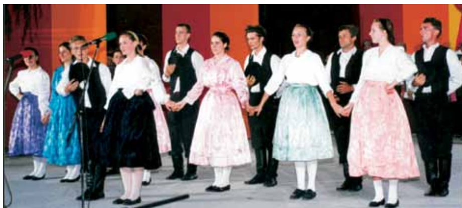
Русинске игре – фолклорни ансамбл

Можете ли замислити аматерско друштво без фолклорне секције? На овим просторима то није ни могуће, а није ни пожељно. Фолклораши са својом младошћу и енергијом, са игром и песмом прави су пример доброг