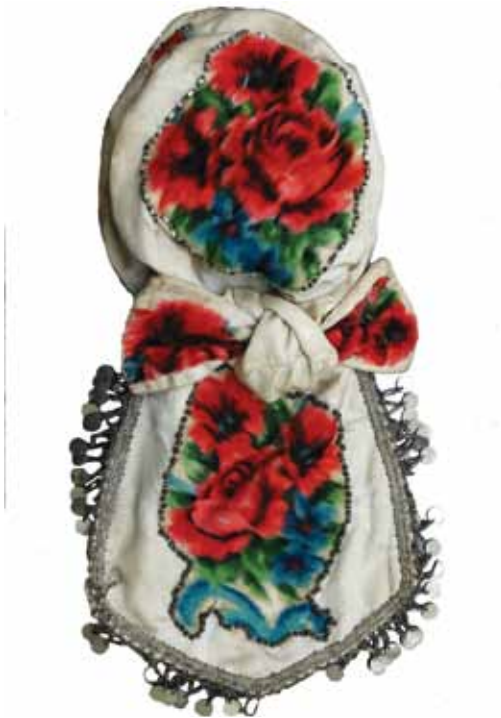
Фитюла .Музейска збирка Културного центра Вербас.