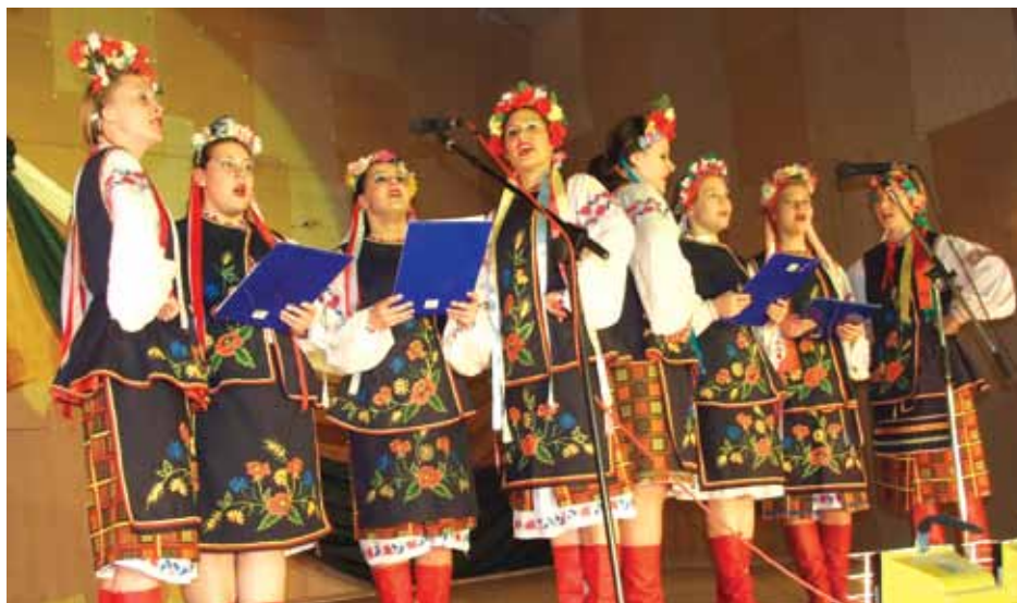
Добар глас и витак стас – омладинке „Карпата”