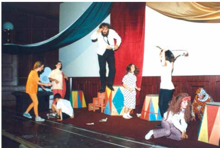
Зубоболни лав не пристаје на дресуру, 1995.