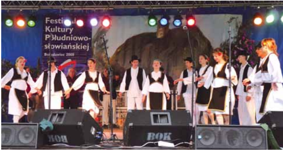
Са играма из Бачке у Пољској, 2009.