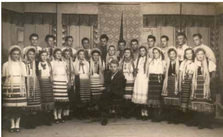
Танечна група културно-просвітнього дружтва „Пушкин” 1952. року