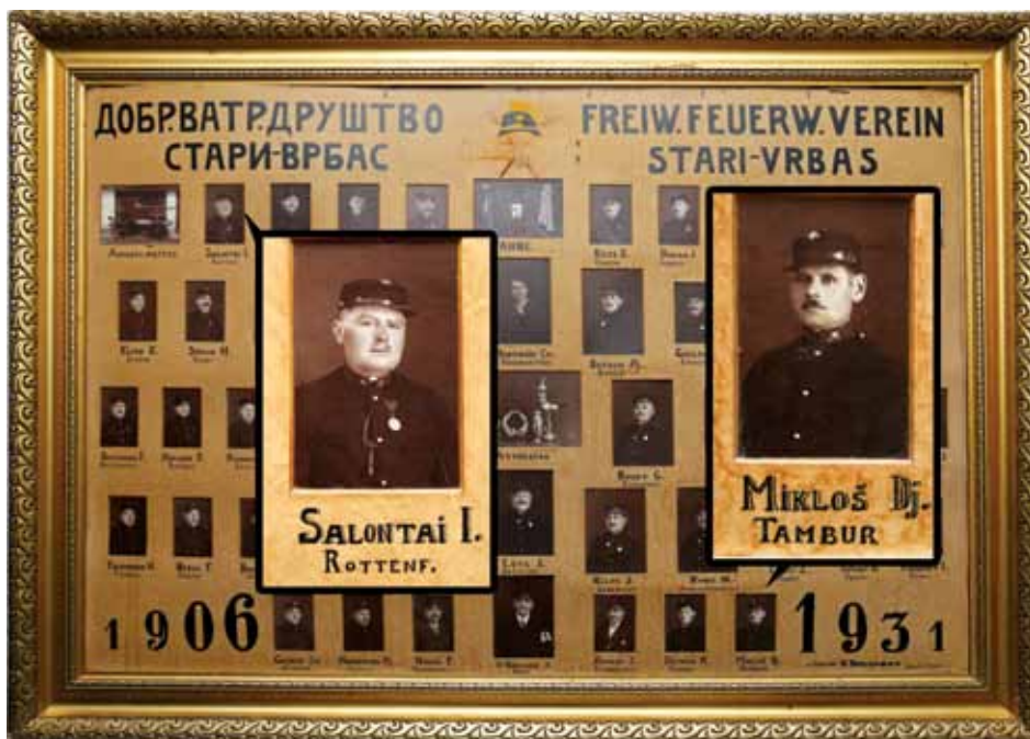
Добровољно ватрогасно друштво. Музејска збирка Културног центра, Врбас. Фото: Борис Билењиќ

Поводом организовања прославе 20-годишњице ослобођења, у Ст. Врбасу је 27. новембра 1938. године била приређена свечаност на којој су учествовали Срби, Русини, Мађари и Немци. На свечаној академији наступио је хор „Читаонице” из Р. Крстура на челу са диригентом Иринејем Тимком. На репертоару је имао русинске и српске песме. 24