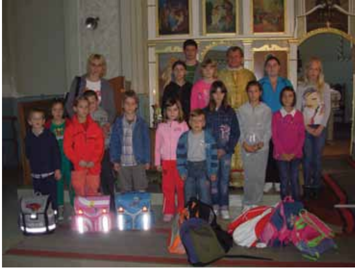
Школяре зоз свою учительку и паноцом на пошведанню школских торбох