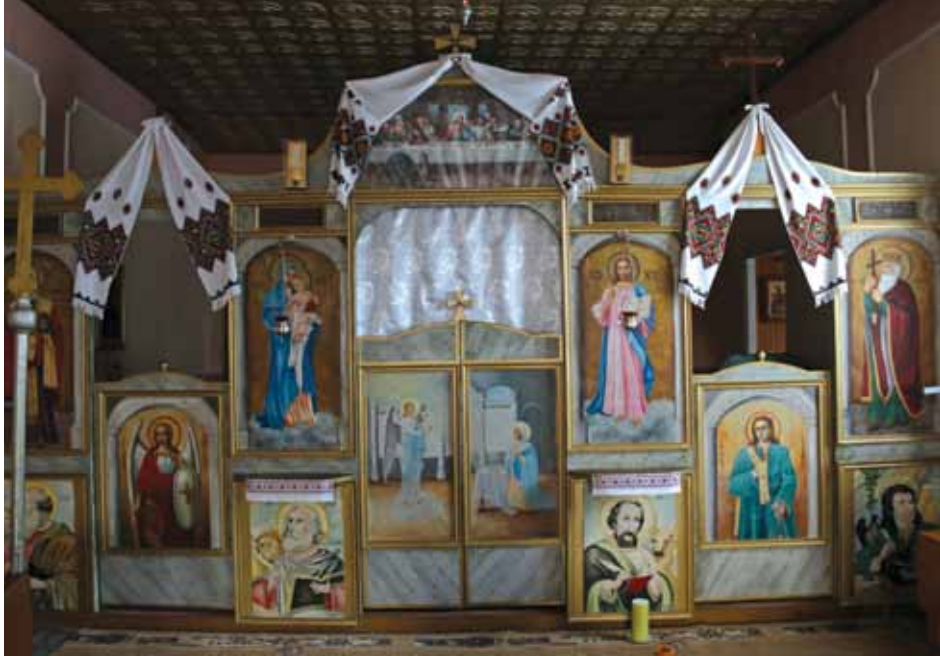
Иконостас церкви у Новим Вербаше.