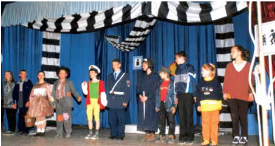
Наталка преко Пешачког острва путује у Словачку