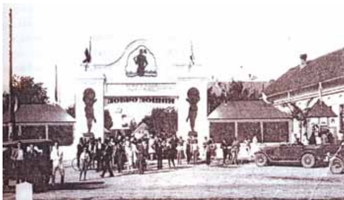
Привредна вистава у Вербаше 1927. року

Руски май- строве и пре свой материални стан и можебуц пре недостаточне зна- ходзене у руково- дзенью зоз роботню дзечнейше робя у цудзих робот- ных як майстрове и майсторски по- моцніки. Руснацох майстрох, односно висококвалифіко-