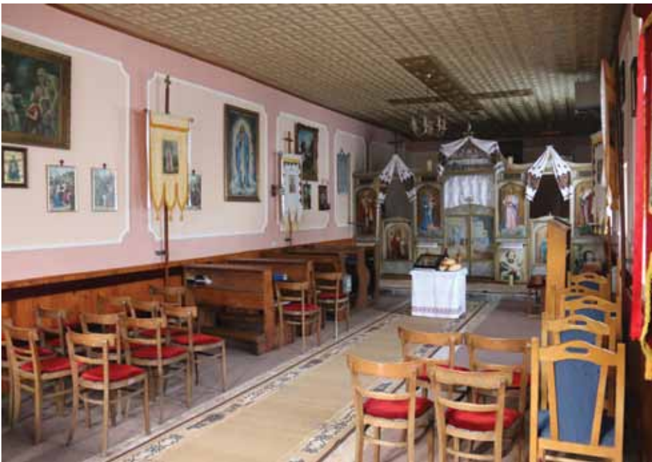
Нукашньосц церкви у Новим Вербаше.