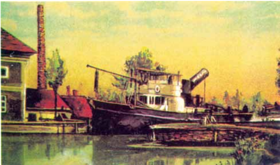
Олеярня „Домача” и преводніца на бегелю у Новим Вербаше

У вербаским майсторским здруженю, по тей матрикули було пейдзешат єдна майсторска діялносц, а шицкого було 388 майстроух котри робели свою роботу, односно тельо було майсторски роботні. Найвещей майстроух єст у Новим Вербаше, вец Старим Вербаше, а найменей у Коцуре. Не направена детальна национална анализа ремеселніцтва, але обачліве же превладую нємцки і мадярски майстроуе, односно фирми, вельо меней єст сербски, а найменей руски роботні і руских регістрованих майстроух.