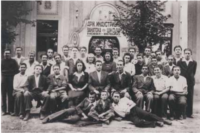
Державна индустријна ремеселніцка школа у Новим Вербаше почала зоз роботу 1945. року