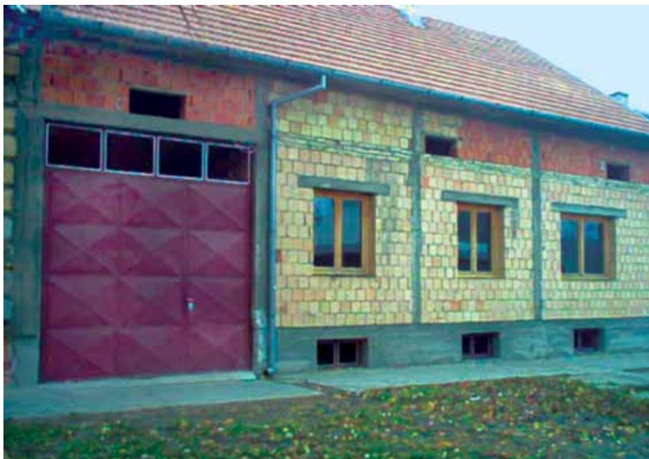
Недовршена зграда у Његошевој 21