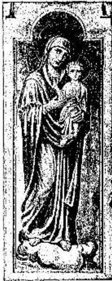
Мати Божя — Царица Рускей Жемі.