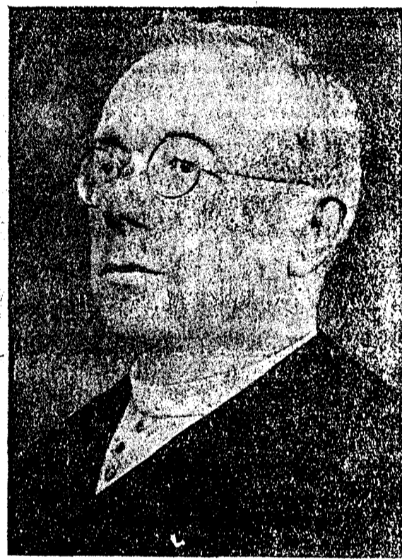
МОНСИЊОР АВГУСТИН ВОЛОШИН

руски министр за желѣзници, пошту и телеграф (пред даскѣльѣома роками бул вон у Керестуре и других наших валалонох).