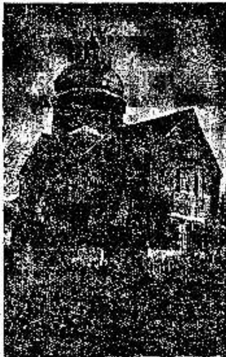
Наша грекокат. церква у Девятини (Босно).

Красни доказ любови до своей вири и народней зложивости дали нам прешлого року пїшє брата у Славонїи и Босней, кєд у такєх чежких часох збудовали два красни храми божи, котрих слики приносїме. Да ше може подплатно розумїти, яка то велька жертва тих