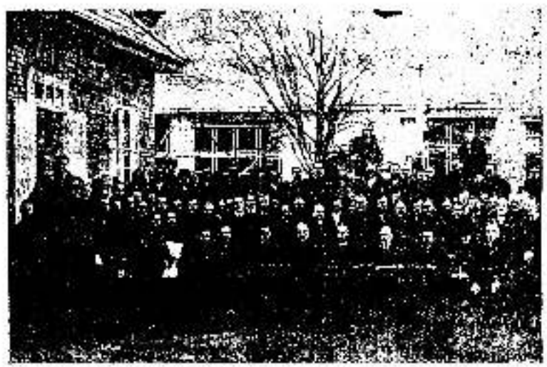
Рочна Га. Сходка РИПД-а у Руским Керестуре 1936. р. (Лидо Друкарня „Просвита“)