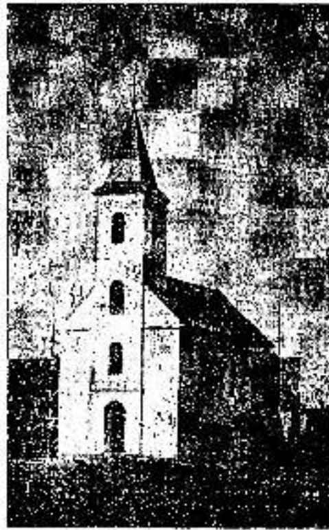
Наша гр.-кат. церква у Канжи (Славонїя)

Вони складала на тоти церкви, не ганьбєли ше ходїац и питає од людзох дарункї на храм Божи. Кєд вони а таку любовїю робєла да себе створа — збудую церкви, дає ше буду зберає и ведно Богу служїа, ми, по мамє одавна свойо краснє вельки церкви, ста-