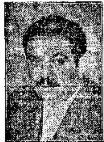
Пер Лавал председателъ фрнц. вѣлѣи

Французка терас у вѣлѣскѣи испрѣлики, бо з Италию трѣици не шме, гѣи бѣи можебуц и сѣсла. За Италию баржей цага и виш прѣдѣ. Лавал, али скоро половака парламанту с прѣ-ци Итали. Французкей најбохрей стало, да иѣ Англия тарантуе помод проти Немцкей, а Англия сарактиват на сѣи.