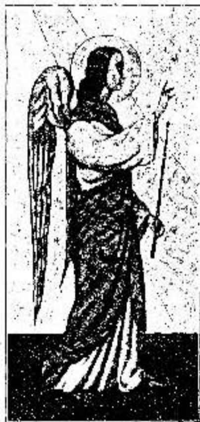
Ангел на дзверох иконостаса.