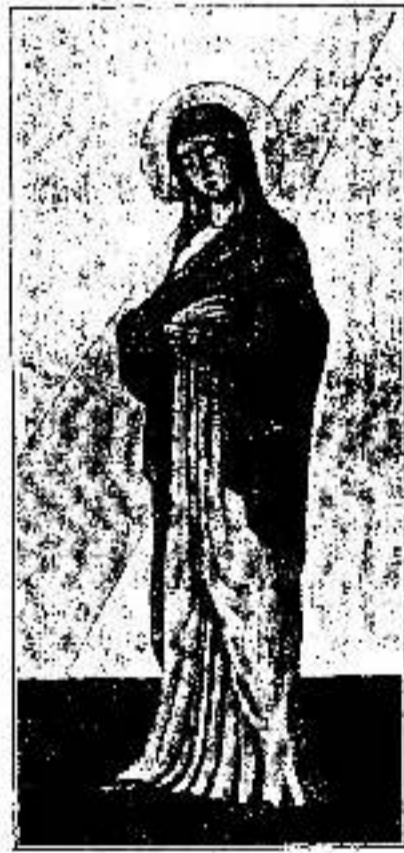
Марія на дзверох иконостаса.

тем, шоб да брані, да святиго Престола Божого низакоче космето рука скверних". У другим шоре приказује икони живог Христа, а у штрелко Тайна Вечера. У третим шоре находза ше дванад апостола, а поверху них дванад пророки старого завета. Медан німа у штрелку ест образ пресвятей Троици, а над нїм Росице, под котрим стої Мати Божя жалостива и ученик, етоже любляше Исус" св. Иоан апостол.